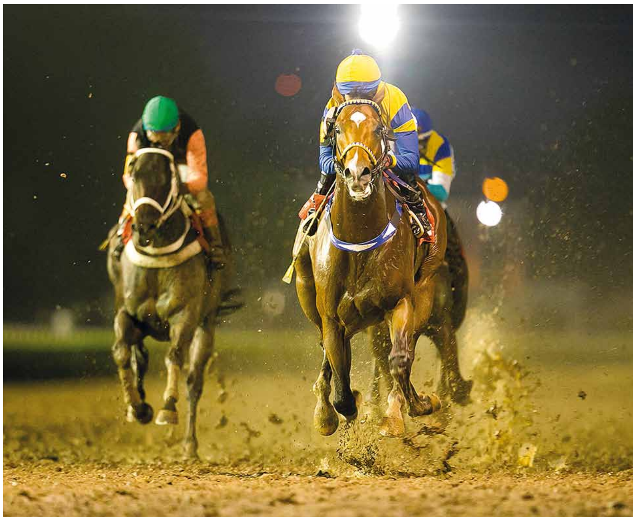
Scarlatti aprovechó su viaje a La Plata de donde se trajo un trofeo clásico