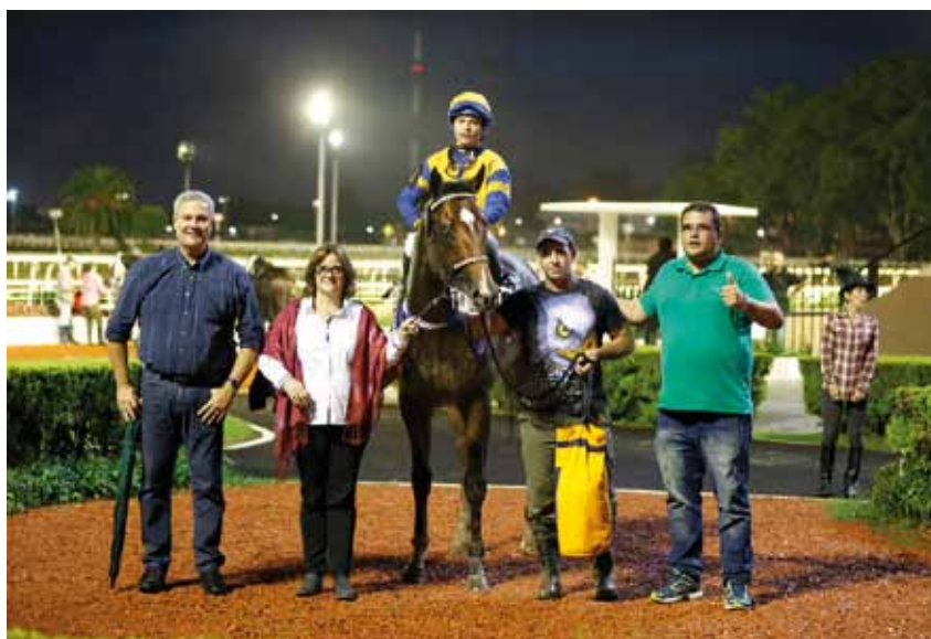
La Providencia sigue sumando victorias clásicas en La Plata

su primera victoria más allá de las comunes, Scarlati llegó al 50% de efectividad con su cuarta medalla en ocho salidas y ya sea dentro del plano local o en el Norte, los dos lugares donde ha ganado, seguirá buscando su techo.