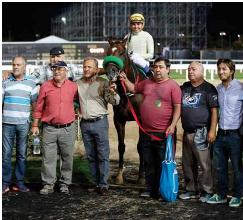
La gente del stud Santa Rita se ilusiona con Los Años Locos

LOS AÑOS LOCOS (Nº 6) Ganó de punta a punta. CHE PATRON KEY (Nº 7) Último y anteúltimo, en potente carga 2º en los 150. ULTIMA VUELTA (Nº 2) Se fue acomodando de menor a mayor y 3º en los 150.