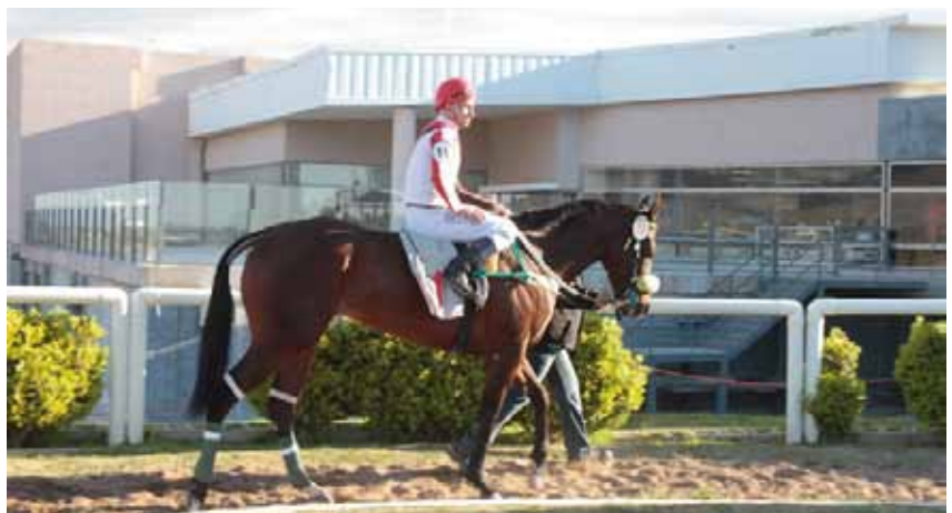
Che Milonguera logró una muy cómoda primera victoria jerárquica por 3 cuerpos