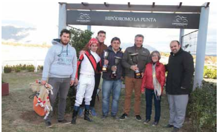
El Clásico Marina Lezcano es un justo reconocimiento a la mejor jocketa de la historia