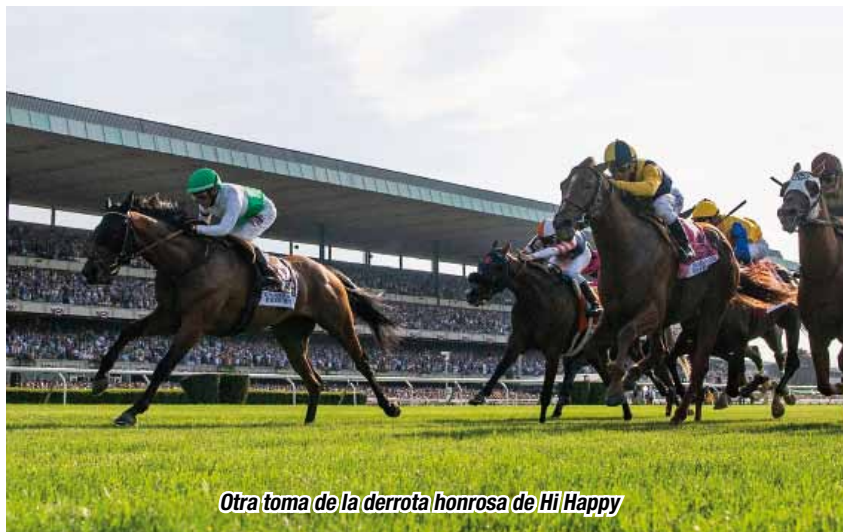
Otra toma de la derrota honrosa de Hi Happy

Para el final quedan número impactantes, como siempre. Se apostaron un total de US$ 137.954.895, la segunda suma más alta en la historia de NYRA (New York Racing Association), detrás del Belmont en el que California Chrome (Lucky Pulpit) fue derrotado por Tonalist (Tapit). Aquella tarde se alcanzó una recaudación total por US$ 151.109.373. Es más, en 2015, el día que American Pharoah quebró un karma