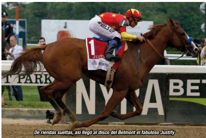
De riendas sueltas, así llegó al disco del Belmont el fabuloso Justify

El potrillo del China Horse Club International Ltd., Win Star Farm, Starlight Racing & Head of Plains Partners LLC, al que crió John Gunther, incrementó un listado que conforman Sir Barton (1919), Gallant Fox (1930), Omaha (1935), War Admiral (1937), Whirlaway (1941), Count Fleet (1943), Assault (1946), Citation (1948), Secretariat (1973), Seattle Slew (1977), Affirmed (1978) y American Pharoah (2015). El mismo potro que se vendió en la subasta de septiembre, en Keeneland, en un total de US$ 500.000,