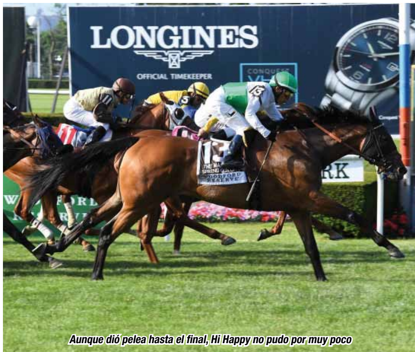
Aunque dió pelea hasta el final, Hi Happy no pudo por muy poco

Fue el sexto hito en once entregas, mientras el caballo del Stud – Haras La Providencia quedó a nada de escribir su