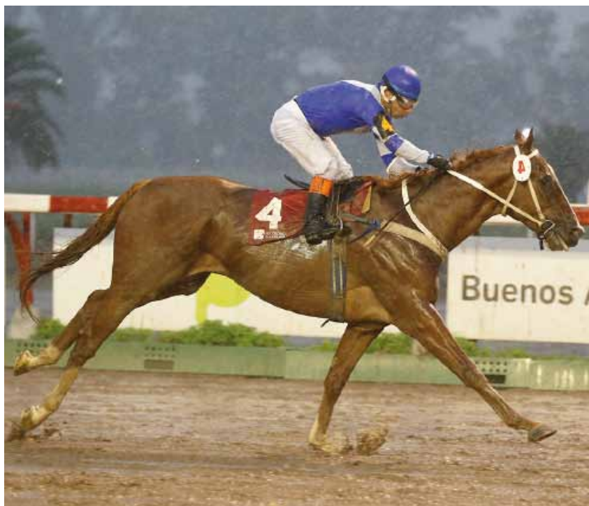
El de La Frontera obtuvo su primer triunfo en 2000 metros.

✉ Por Roberto Pico rpico@revistapalermo.net