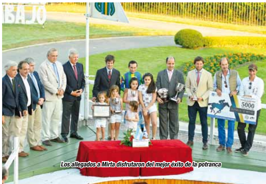
Los allegados a Mirta disfrutaron del mejor éxito de la potranca

que se le tenía no era erróneo. Así las cosas, Mirta obtuvo su segundo triunfo, primero clásico, en siete presentaciones y quedó en condiciones de soñar con la Copa de Plata frente a las adultas.