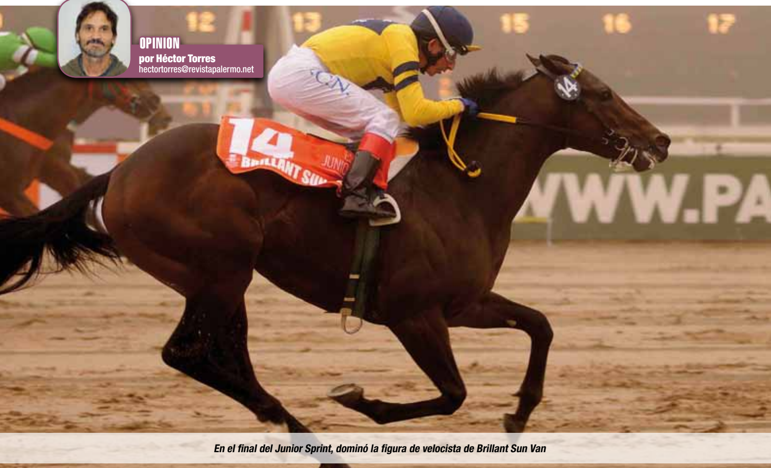
En el final del Junior Sprint, dominó la figura de velocista de Brilliant Sun Van

por Héctor Torres hectortorres@revistapalermo.net