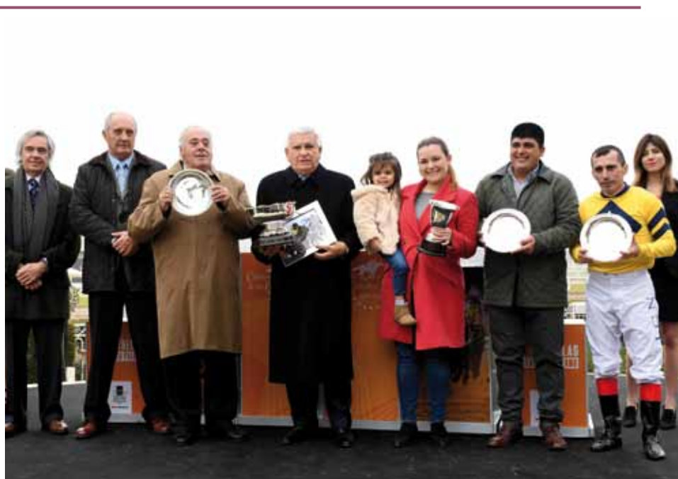
La gente de Marías Del Sur vió premiado su sacrificio

BRILLIANT SUN VAN (Nº 14) Guapeando prevaleció de punta a punta. DE VICENZO (Nº 7) De atrás, cargó por dentro 3º en los 200 y 2º en la raya peleando la victoria. MY INTENSE BOY (Nº 1) Quinto y 4º, 2º en lucha por la punta desde los 300, quedó 3º en la raya. MONTESANA RYE (Nº 2) Se fue acomodando de menor a mayor y 4º por los 150.